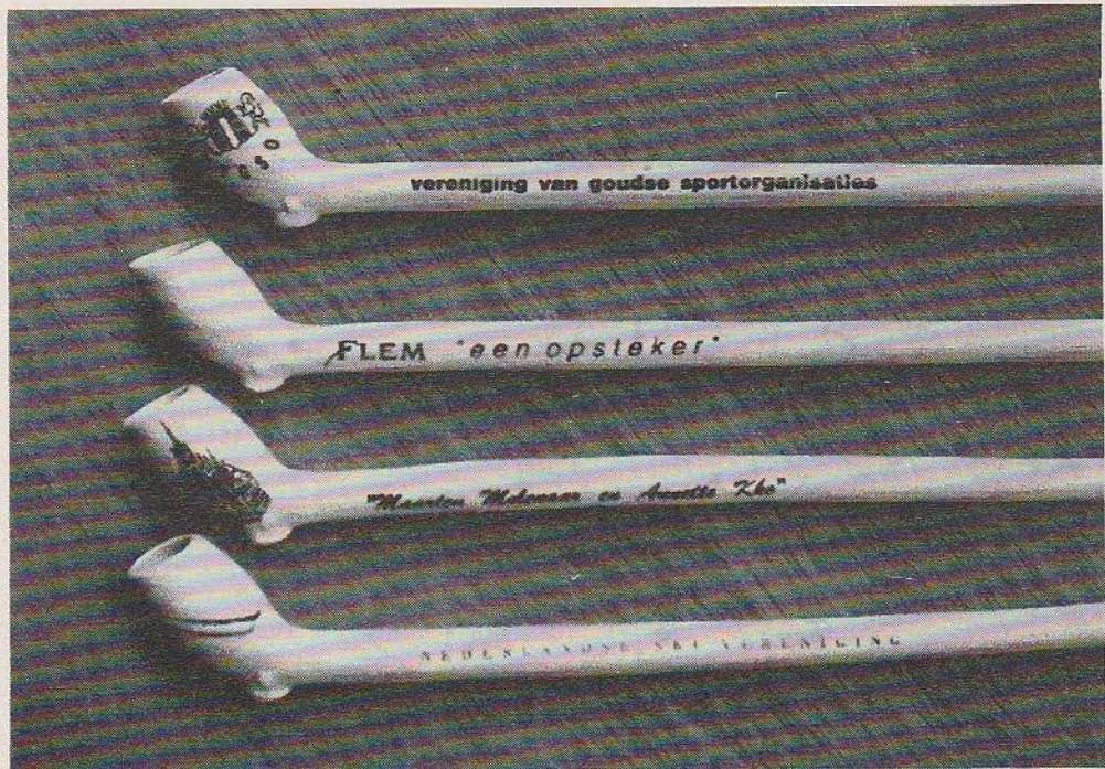
boven: kort Gouds model - onder: Jan Steenpijp